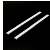
マグネットバー白2本組 ¥1,600 (税込¥1,760) ¥300マグネットバー2本入