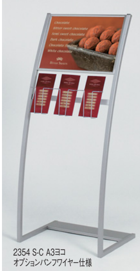
2354 S-C A3ヨコ オプションパンフレット仕様