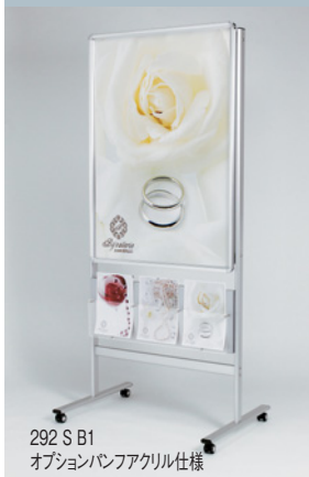
292 S B1 オプションパンフレット仕様