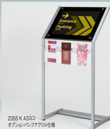
2355 K A3ヨコ オプションパンフレット仕様