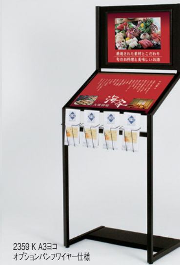
2359 K A3ヨコ オプションパンフレット仕様