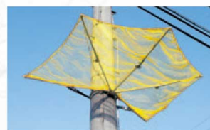
FN-10(アーム折りたたみ式)