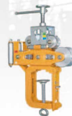
BR-YD10 制動力調整タイプ