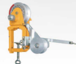
BR-T1010 ディスクブレーキタイプ