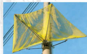
FN-12K アーム部にアルミを採用した軽量型