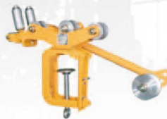
BR-K10 アーム押さえブレーキタイプ