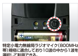
特定小電力無線周波数マイク(800MHz帯)規格に適合しており10波の中から1波を選択して利用可能。