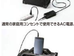
スマートフォンやタブレットが置ける賜福スタンド付き。