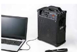
外部音声入力を搭載しており、音楽再生が可能。同時にマイク音声出力も可能。