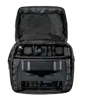
収納・保管や持ち運びにも便利な収納用バッグ付き。