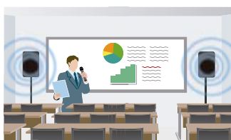
外部音声出力(LINE OUT)も搭載しており、外部機器への録音や、本製品複数台をカスケード接続することで複数台のスピーカーから同時に拡声出力することも可能。