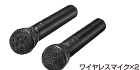
ワイヤレスマイク×2