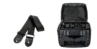
本体に取付けて使えるショルダーベルト付き。