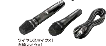
ワイヤレスマイク×1 有線マイク×1