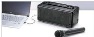
外部音声入力を搭載しており、音楽再生が可能。同時にマイク音声出力も可能。