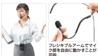
フレキシブルアームでマイク部を自由に動かすことが可能。