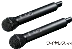
ワイヤレスマイク×2