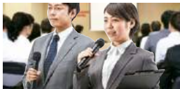
ワイヤレスマイクと有線マイクを同時に使用することが可能。