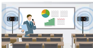
外部音声出力(LINE OUT)も搭載しており、外部機器への録音や、本製品複数台をカスケード接続することで複数台のスピーカーから同時に拡声出力することも可能。