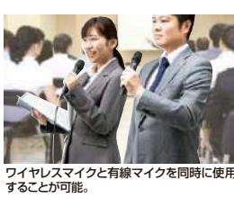
ワイヤレスマイクと有線マイクを同時に使用することが可能。