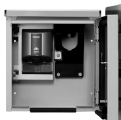
EVR-1R(1HR) コンセント付(200V用) (パナソニック WK4322S)