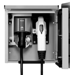
〈充電コネクタケーブル収納例〉