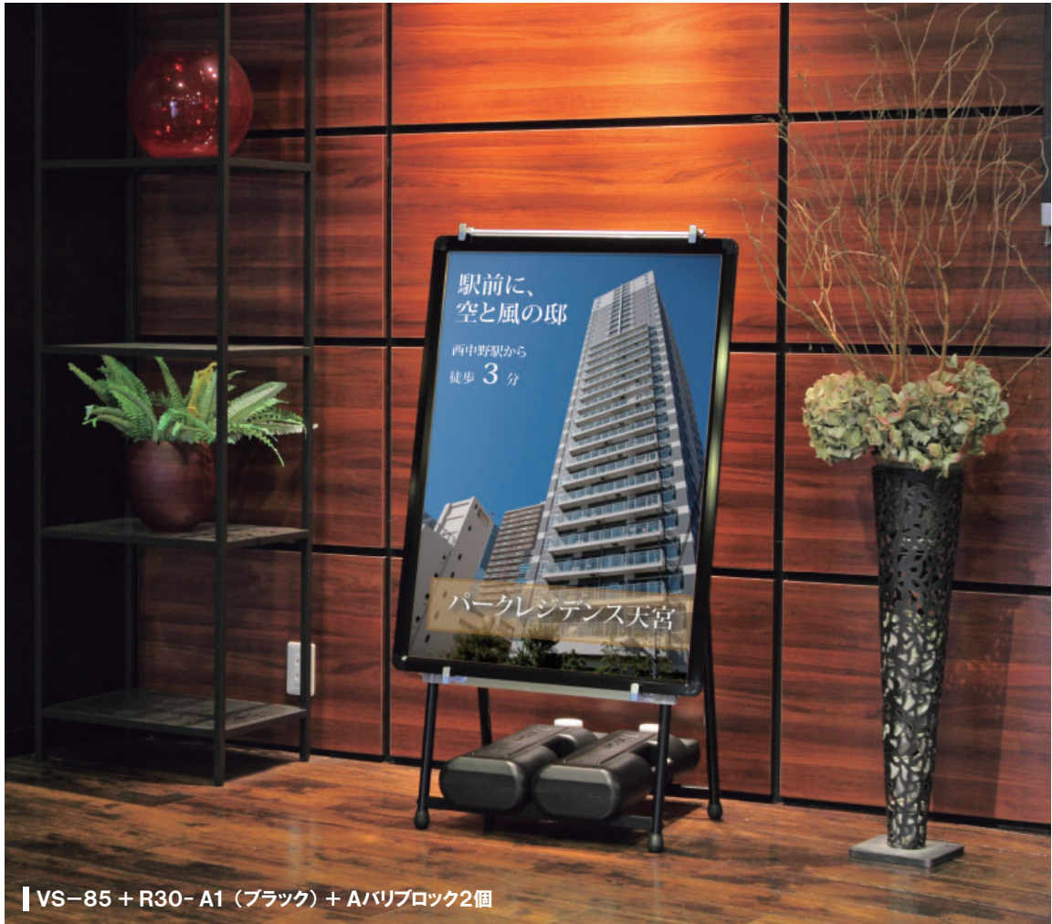
VS-85 + R30- A1 (ブラック) + Aバリブロック2個