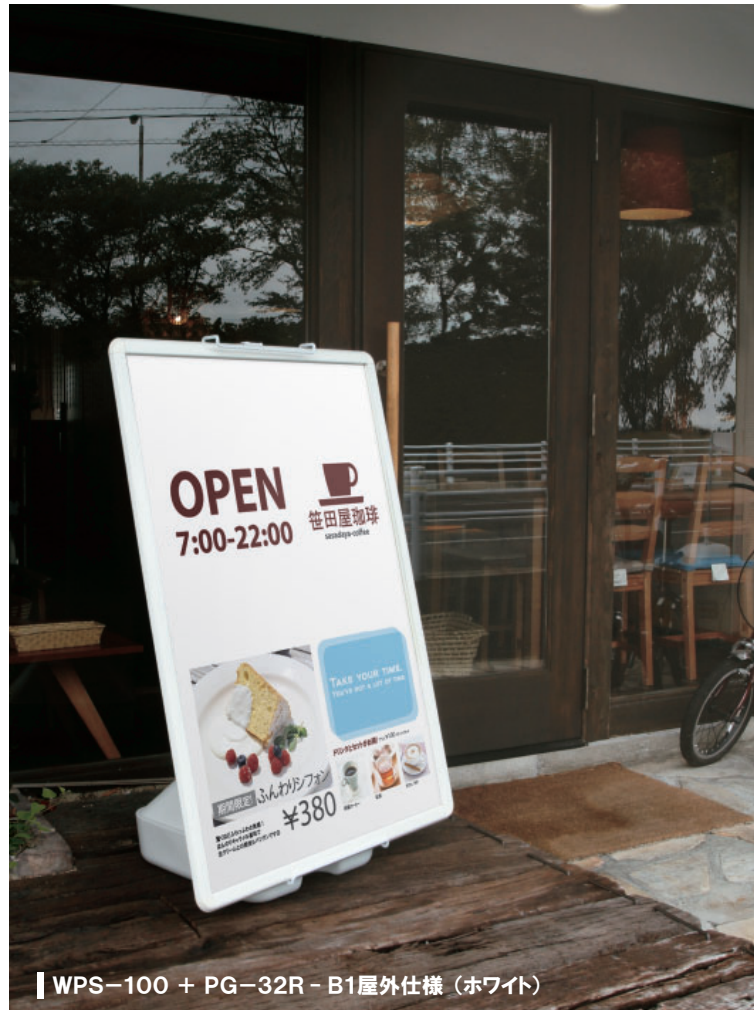
WPS-100 + PG-32R - B1屋外仕様 (ホワイト)