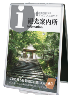
PG32R-B1との組み合わせ例

パネルサイズ ■ 厚み 25mm まで 幅 400 ~ 800mm まで 高さ 700 ~ 1100mm まで ※パネルは含まれておりません。