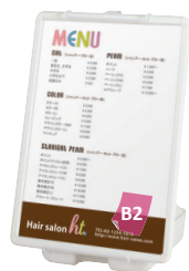
PG32R-B2との組み合わせ例

パネルサイズ ■ 厚み 25mm まで 幅 400 ~ 800mm まで 高さ 700 ~ 1100mm まで ※パネルは含まれておりません。