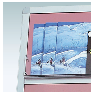
前板：ベツ樹脂透明 背板：ベツ樹脂ブラウンスモーク