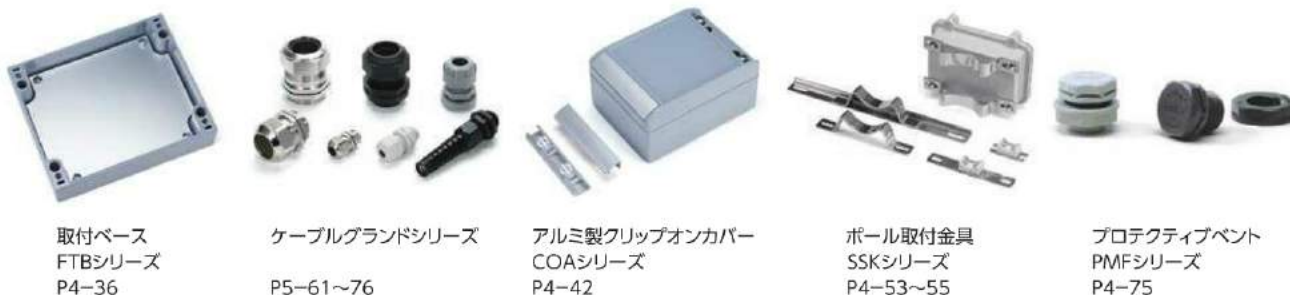
取付ベース FTBシリーズ P4-36