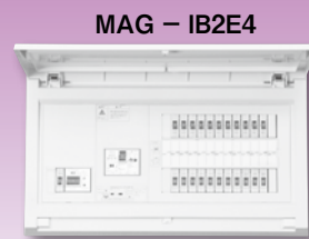
パールテクト(扉付)