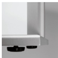
アジャスター付き (オプションのキャスタ付きにはアジャスターは付きません)