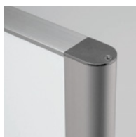
サイドアーチデザイン