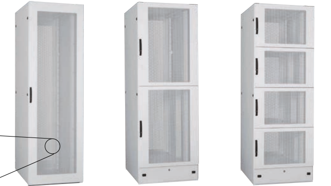
FSH100-720EN-1H (分割なし仕様) FSH100-720EN-2H (2分割仕様) FSH100-720EN-4H (4分割仕様)