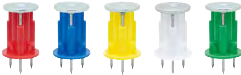
品番表 コードNo.M10047 スパイカー ※引抜試験値は破壊時の数値です