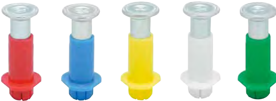
品番表 コードNo.M10065 プレートハンガー ※引抜試験値は破壊時の数値です

※薄物プレート（キーストンプレート）には、転倒防止のため「キーストマン」スプリングタイプをご使用ください。（→39ページ参照）