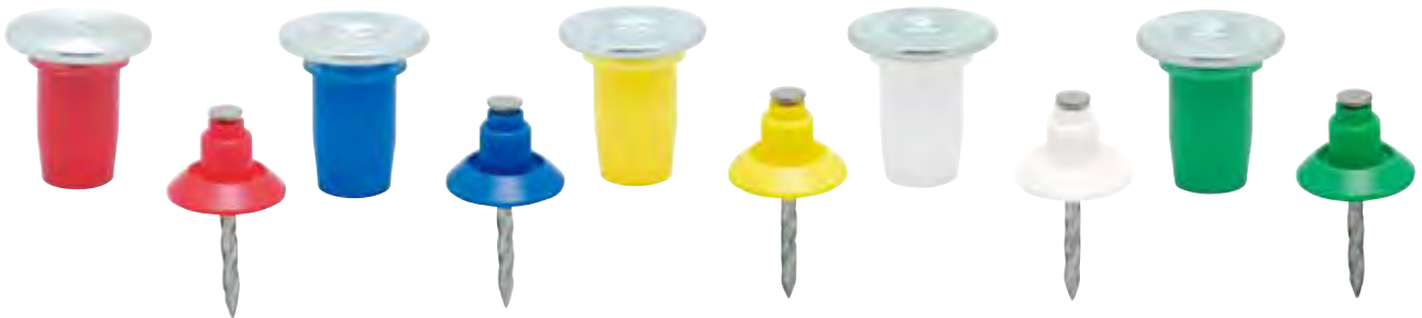
品番表 コードNo.M10049 ライトホール ※引抜試験値は破壊時の数値です

※より完璧な防錆効果をお求めの際は、ステンレス製 【カラーホール】（→ 50 ページ参照）をご使用下さい。