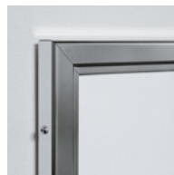
(ローレットビスは付属の⊕ネジに交換可能です)