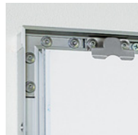
クリップ金具付き