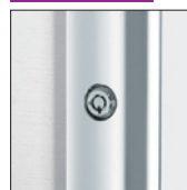
鍵(フレーム正面に付きませ) 2ヶ…¥15,200(税込¥16,720)