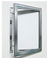
扉を手で開いてソフトをセットします。