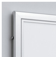
簡易ロック標準装備