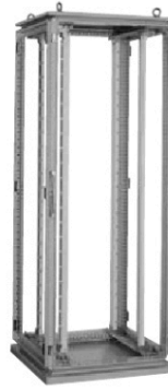
FJ60-819E (扉・背面板・両側板取り外し状態)