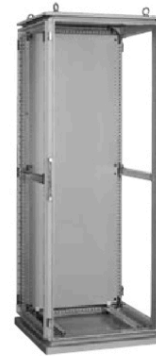
FJ60-819T (扉・背面板・両側板取り外し状態)