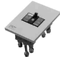
〔NE103AB + NA2103J 組合わせ例〕

■表面形ブレーカには取り付けることができません。必ず裏面形ブレーカをご使用ください。