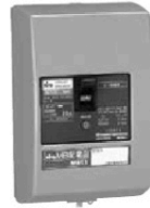
MB53 3P 30A