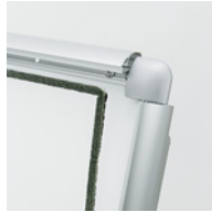
防水テープ付き 透明版