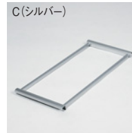
C(シルバー) 保持パイプは標準仕様で付属します。