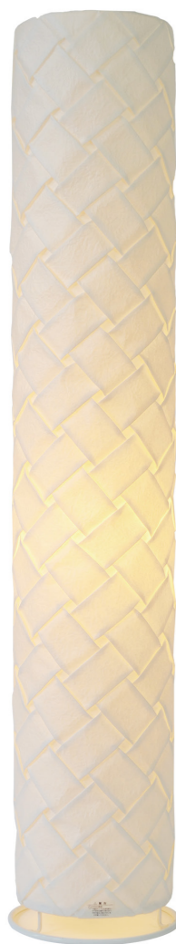
VF-2054 color: 織姫