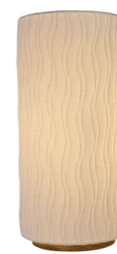
VS-3047 color: 舞姫