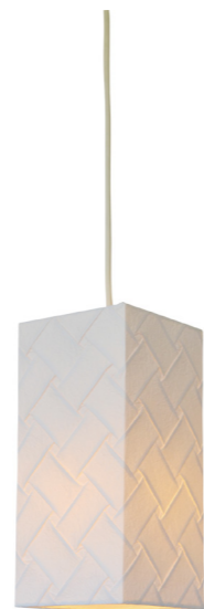
VPN1-1901 color: 織姫