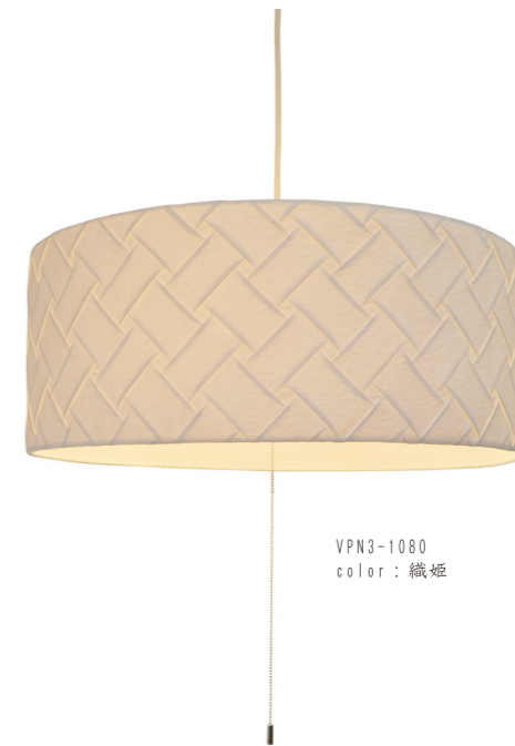
VPN3-1080 color: 織姫