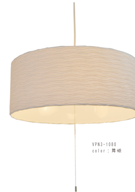
VPN3-1080 color: 舞姫