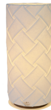
VS-3047 color: 織姫