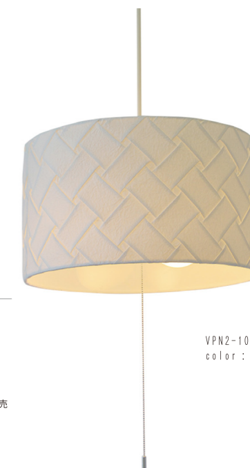
VPN2-1051 color: 織姫