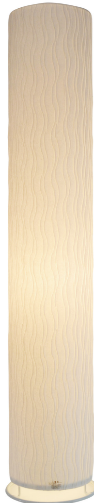
VF-2054 color: 舞姫