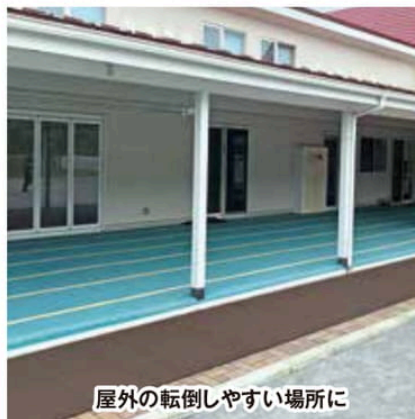
屋外の転倒しやすい場所に