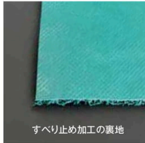
すべり止め加工の裏地

マットの表面はクッション性が高いコイル層。裏面はすべり止め加工の裏地付きで、表面に落ちた砂や埃などはコイルを通過して下にたまる構造になっています。