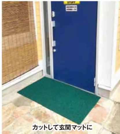
カットして玄関マットに