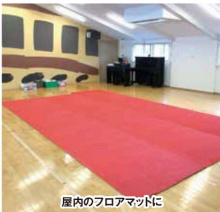
屋内のフロアマットに

ハサミやカッターで好きなサイズにカットできます。玄関マットやカーフロアマットにもおすすめです。