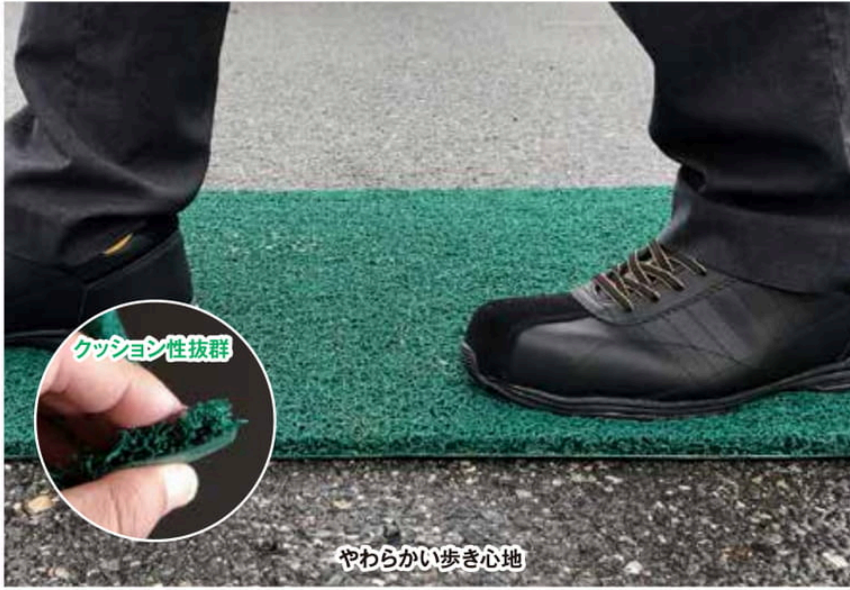
やわらかい歩き心地