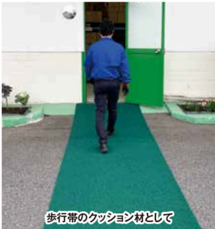
歩行帯のクッション材として