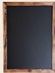
焼杉ボード 17-445-08 (49491) 4,000円 チョークタイプ 約45×60×1.7cm ※ボード板面：約38×53cm ※ブラックボードチョークタイプ ※マグネットには対応しません。