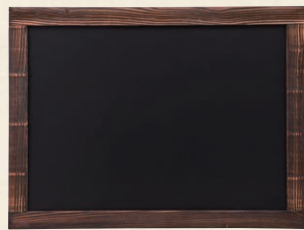
アンティーク調木製ブラックボード 17-445-02 (49521) 4,500円 約60×45×1.9cm ※ボード板面：約52×37cm ※ブラックボードチョークタイプ ※マグネットには対応しません。