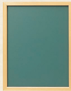
白木グリーンボード 17-445-03 (48224) 7,800円 チョークタイプ 約48.5×63.5×2cm ※ボード板面：約42.5×57.5cm ※マグネット対応