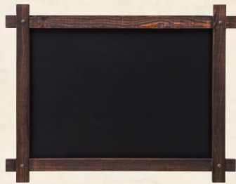
アンティーク調木製井桁ボード 17-445-01 (49522) 5,000円 約66×51×1.9cm ※ボード板面：約52×37cm ※ブラックボードチョークタイプ ※マグネットには対応しません。