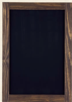
アージュ 新サインボード 17-445-06 (49448) 5,800円 マーカータイプ(茶) 約47×67×1.8cm ※ボード板面：約37×57cm ※ブラックボードマーカータイプ ※マグネット対応