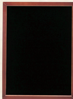
ブラックボード 17-445-10 (59262) 8,800円 マーカータイプ 約48.5×63.5×2cm ※ボード板面：約42.5×57.5cm ※マグネット対応