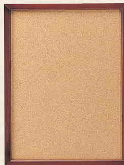
コルクボード 17-445-14 (49463) 7,000円 約48.5×63.5×2cm ※ボード板面：約42.5×57.5cm ※マグネットには対応しません。