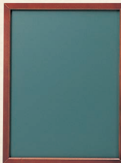
グリーンボード 17-445-12 (49461) 7,800円 チョークタイプ 約48.5×63.5×2cm ※ボード板面：約42.5×57.5cm ※マグネット対応