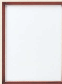
ホワイトボード 17-445-11 (59462) 8,800円 マーカータイプ 約48.5×63.5×2cm ※ボード板面：約42.5×57.5cm ※マグネット対応