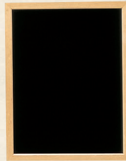
白木ブラックボード 17-445-04 (48223) 8,800円 マーカータイプ 約48.5×63.5×2cm ※ボード板面：約42.5×57.5cm ※マグネット対応