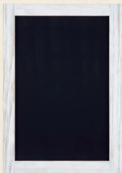
アージュ 新サインボード 17-445-07 (49449) 5,800円 マーカータイプ(白) 約47×67×1.8cm ※ボード板面：約37×57cm ※ブラックボードマーカータイプ ※マグネット対応