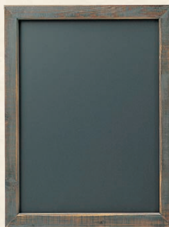
アージュ サインボード 17-445-09 (48230) 7,000円 チョークタイプ(ダークブルー) 約48.5×63.5×2cm ※ボード板面：約41×56cm ※マグネット対応