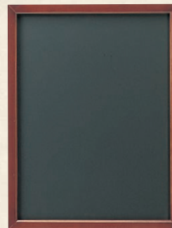
ブラックボード 17-445-13 (49460) 7,800円 チョークタイプ 約48.5×63.5×2cm ※ボード板面：約42.5×57.5cm ※マグネット対応