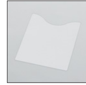
A4用紙押えプレート ¥500(税込¥550)