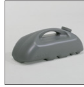
M-909 (満水時1ヶ11kg) ¥2,300(税込¥2,530)