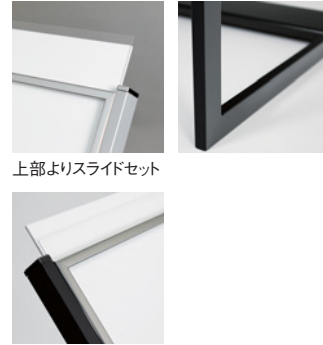
上部よりスライドセット

上部傾斜のスタンダードな片面サイン用のインフォメーションスタンド。 表示面はプリント出力した紙をはさみ込んでセットするだけ。 オフィス、公共施設、店舗などの案内に案内にお使いください。